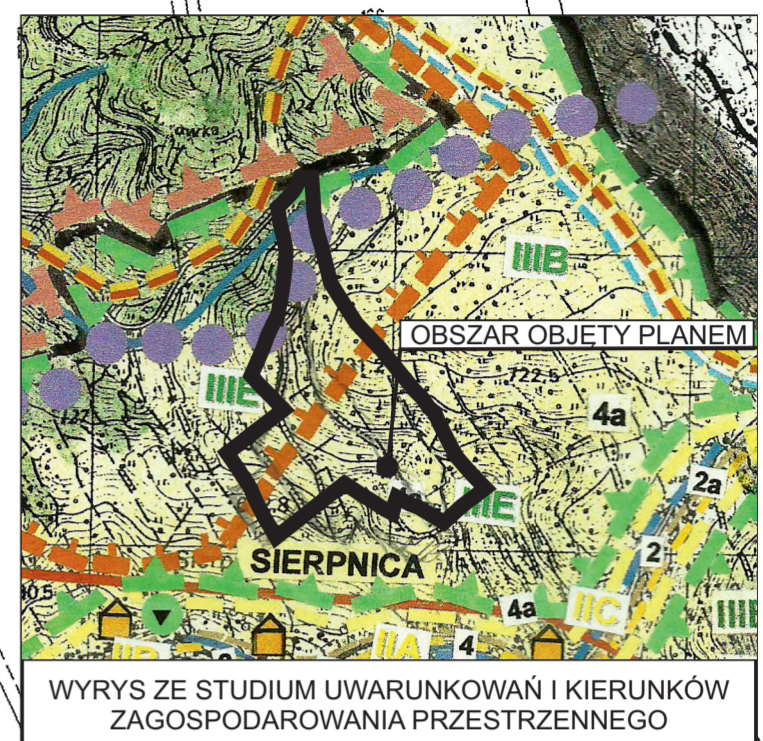
WYRYS ZE STUDIUM UWARUNKOWAŃ I KIERUNKÓW ZAGOSPODAROWANIA PRZESTRZENNEGO

Województwo: dolnośląskie Powiat: Głuszyca Urząd Miejski w Głuszycy Wydział Inżynierii i Kartograficznego Biuro Inżynierii i Kartograficznego Nazwa materiału zasobowego: Mapa zasadnicza Identyfikator ewidencyjny: 022105_5_0005 Data wykonania planu: 21-01-2019 Miejscowość: Głuszyca Imię, nazwisko i podpis osoby: Andrzej Poniewierski